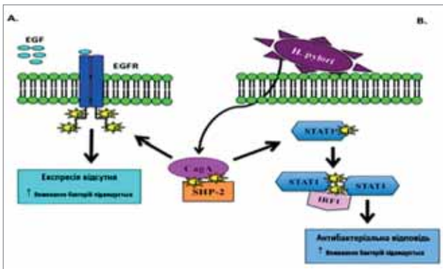
Рис. 2. Схематичне зображення H. pylori в шлунковому епітелії: (А) SagA індукує дефосфорилювання EGFR, що скасовує експресію hBD3 і підвищує життєздатність бактерій; (В) SagA інгібує IFN- \gamma -залежний сигнал STAT1, що, своєю чергою, сприяє виживанню бактерій [50]