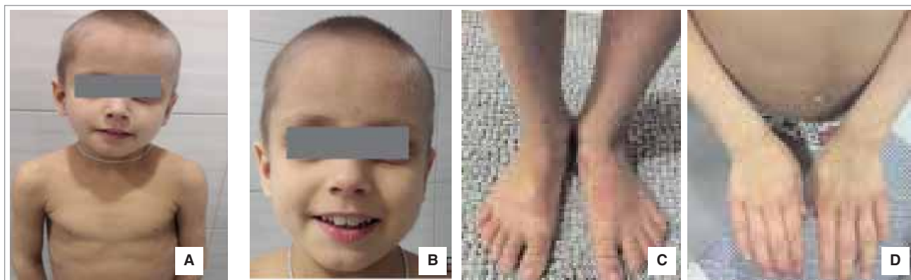
Рис. 2. Зовнішній вигляд дитини на момент госпіталізації

Видимі слизові бліді, склери світлі. Слизова губ рожева, тріщина на нижній губі. Помірно виражена пальмарна еритема, судинна сітка на передній черевній стінці, деформація нігтьових пластинок за типом годинникових скелець. Частота дихання – 34/хв. Форма грудної клітки бочкоподібна, розвернута нижня апертура, дихання шумне, чути на відстані, з подовженим