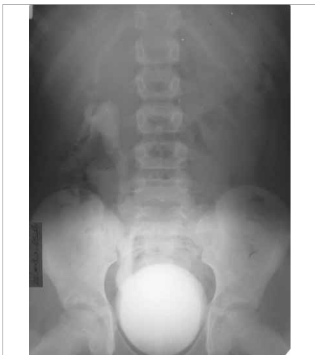
Рис.7. Мікційна цистоуретерографія пацієнта

УЗ-ознаки міхурово-сечоводного рефлюксу праворуч. УЗ-ознаки пієлонефриту».