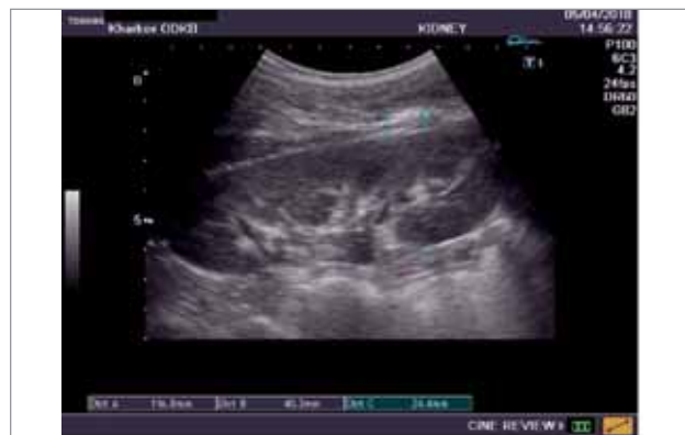
Рис.4. Бікарна гіпертрофія лівої нирки пацієнта