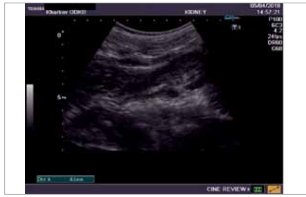
Рис.3. Візуалізація сечоводу у воротах правої нирки пацієнта