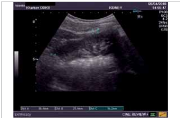
Рис.1. Права нирка пацієнта