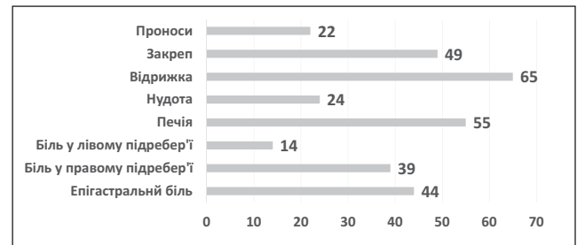
Рис. 1. Скарги юнаків із гіпоандрогенією (%)

За результатами визначення показників вуглеводного обміну встановлено, що рівень глюкози натще майже у всіх юнаків не перевищував верхньої межі норми. Стан інсулінорезистентності за підвищенням індексу НОМА-IR достовірно частіше визначався